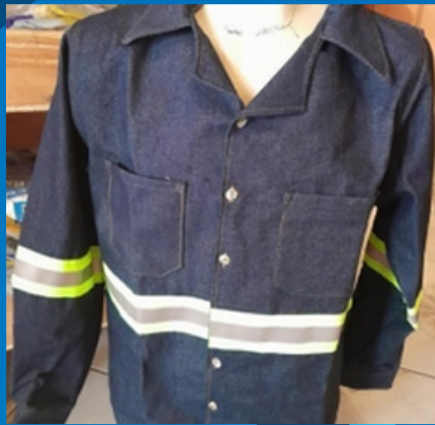
REF. AMARILLO CH, M, L, XL Y 2XL